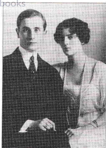
Prințul și prințesa Iusupov

salve în momentul în care începea vizita imperială și astfel, ca să-l cităm, «a fost regizată o adevărată scenă de luptă». Țarul a fost fericit și le-a mulțumit tuturor, iar bravul nostru războinic a primit Crucea Sfântului Gheorghe pentru reușita spectacolului. 22