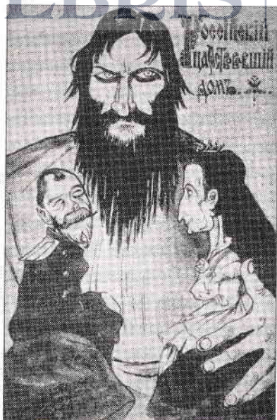
Rasputin, țarul și țarina